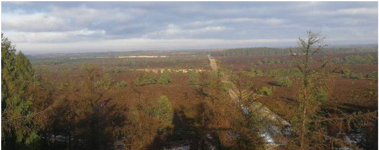
Udsigten fra tårnet ved Mindestenen.

Dagens vandretur går gennem en af de gamle københavnerplantager. Turen starter durk ad vejen mod nord i fotoet, tværs gennem den til den tid blomstrende lyng. Senere svinger vi rundt og går syd om P-pladsen for at opleve selve plantagen.