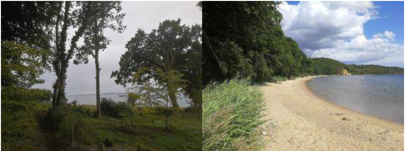
Udsigter ved Fakkegrav

Landskabsturen går gennem den statslige Bankehave Skov der fremover konverteres til urørt skov, og den private Rosenvold Skov. Vi kigger på skovvækst før, nu og i fremtiden. Skovene nord for Veje Fjord, der samlet rummer 2556 ha., er en del af Natura2000 området (N78).