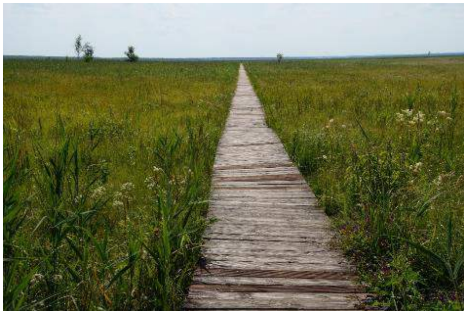
At gå planken ud i mosen

Dagens bustur går til Lille Vildmose, hvor centerets guide tager os på 2,5 times bustur i den hegnede 500 ha. store Tofte Skov. Der er stærkt begrænset færdsel i den hegnede skov, med maksimalt 30 ture om året. Vi har derfor booket dette eksklusive besøg i Tofte Skov for et par år siden.