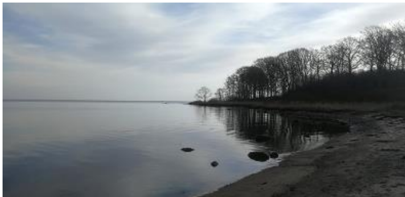
Hundshage en januardag