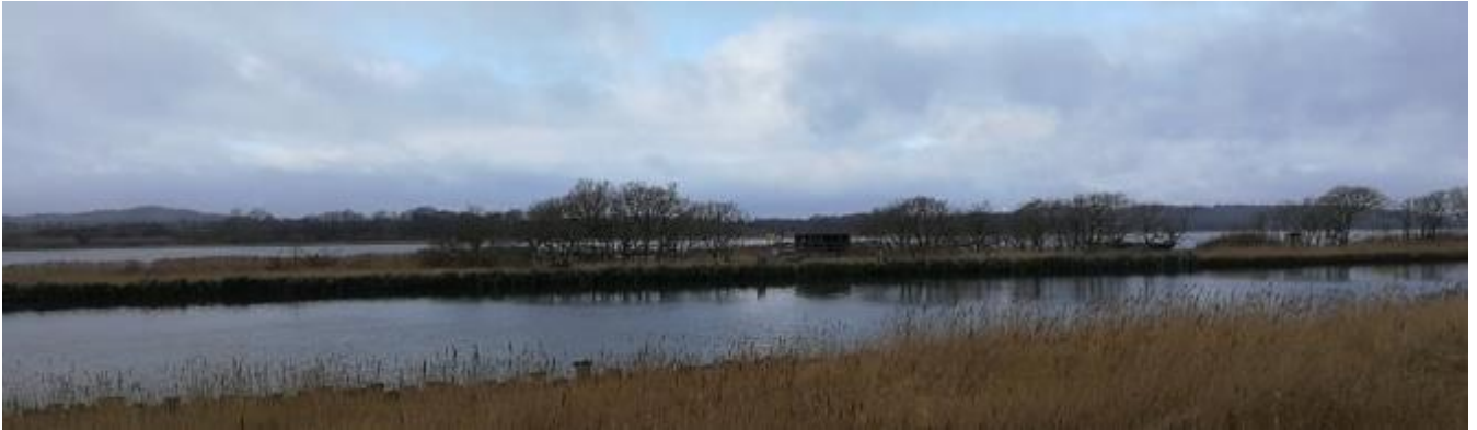
Danmarks næstmindste ø. Kanaløen i Randers fjord. Med madpakkehus. Vinterfoto.

Vi besøger den helt specielle Randers fjord og nyder en kort sejltur med M/S Ragna til den lille "kunstige" ø fra 1908 midt i fjorden. Her spiser vi vore madpakker. Der bliver fri tid ved havnen i Voer. Ragna har besejlet ruten Mellerup-Voer siden 1963. Undervejs til Voer får vi kaffe m/rundstykke ved Ejer Bavnehøj. Efter Voer kører vi til Sangstrup og Karlby klinger, hvor vi skal nyde de smukke og høje kalkklinter af bryozokalk, høre om deres 65 mill. år gamle historie og gå på opdagelse efter fossiler og forsteninger.