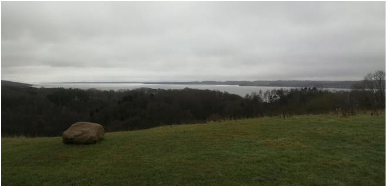
Udsigten fra Skovhavevej en januar dag

Landskabet langs nordsiden af Vejle fjord fra Tirsbæk til Rohden å er fredet ad flere omgange. Udsigterne er milevide fra Vejle by og til Trelde Næs, fjordens udmundning i Lillebælt. Bakkerne er op til 80 m. høje, og talrige vandløb har siden sidste istid gravet sig ned i den fede jord, ned til fjorden som umiddelbart efter istiden var en å der løb til bæltet.